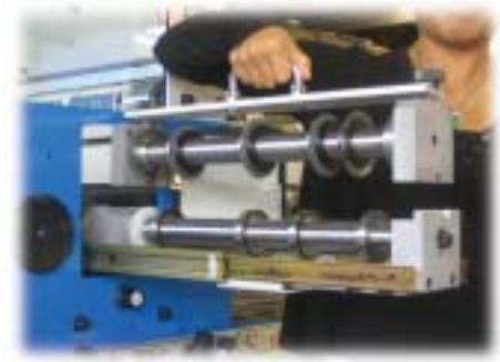
Cassette de refente en deux parties.