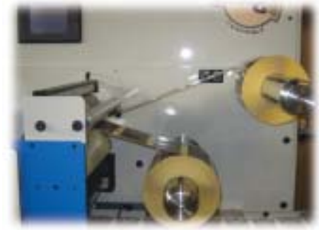
Rembobinage sur deux mandrins.