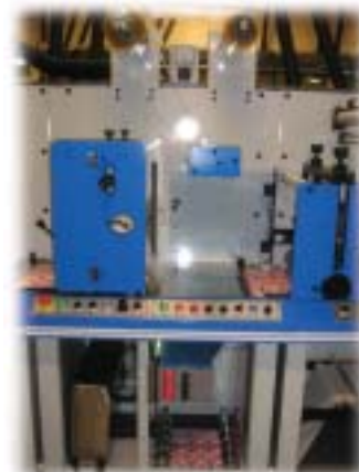
Unité d'impression flexo et unité de pelliculage.

Flexo printing station and laminating unit.