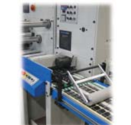
Massicot à format variable Jupiter.