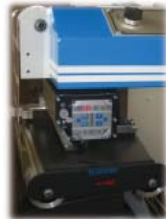
Guide de bande ultra son.

Missing labels and matrix removal detection.