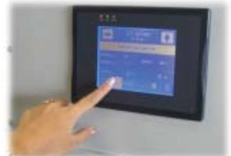
Panneau de contrôle tactile.