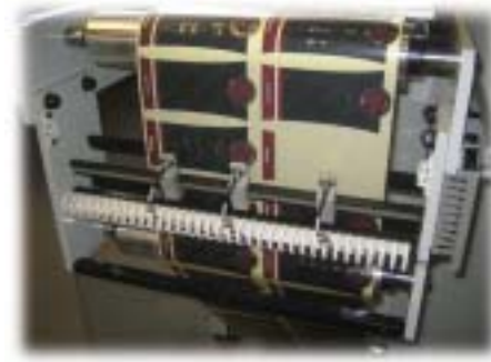
Cellule de manque d'étiquettes et défaut d'échenillage.

Missing labels and matrix removal detection.