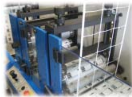
Unité de découpe et échenillage.

Flexo printing station and laminating unit.