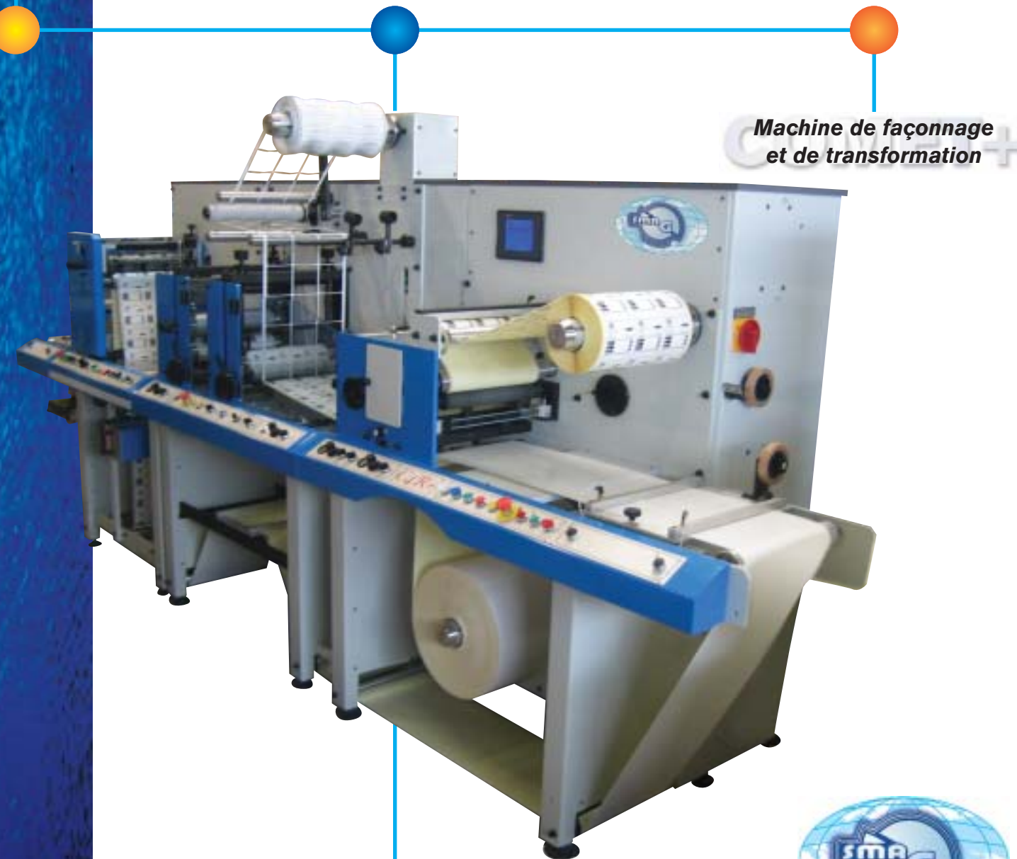
Machine de façonnage et de transformation